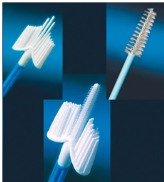
Рисунок 1. Вид рабочей части щеток для получения адекватного материала как с экзо-, так и из эндоцервикса. Материал должен быть получен либо двумя щеткам (А, Б), либо комбинированной щеткой с эндоцервикальным компонентом (В).